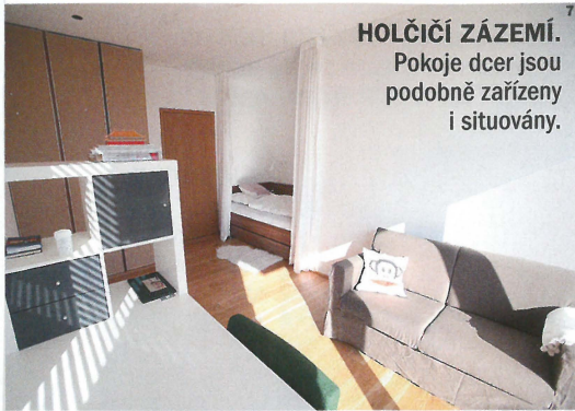
HOLČIČÍ ZÁZEMÍ. Pokoje dcer jsou podobně zařízeny i situovány.