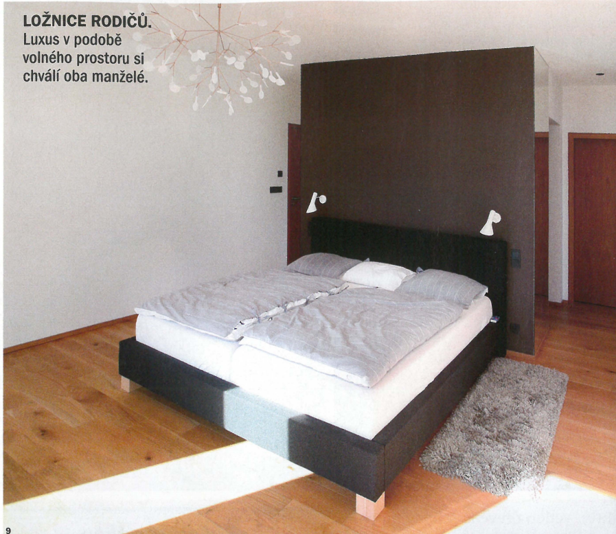
LOŽNICE RODIČŮ. Luxus v podobě volného prostoru si chválí oba manželé.