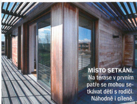
MÍSTO SETKÁNÍ. Na terase v prvním patře se mohou setkávat děti s rodiči. Náhodně i cíleně.